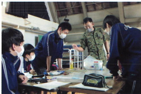
↑ DIG 訓練の様子