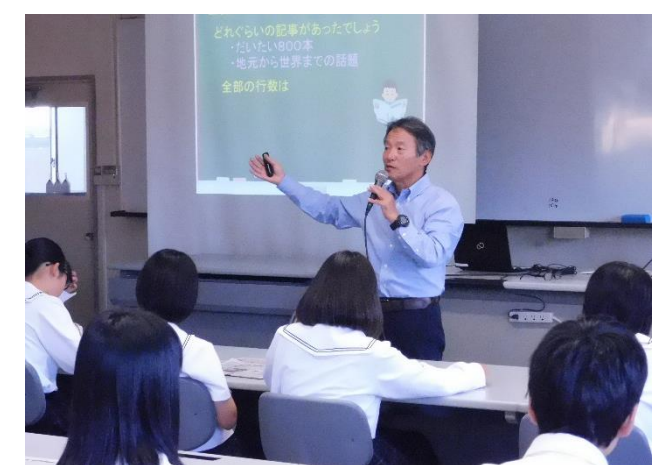
市川先生の“熱さ”が伝わる講義でした。