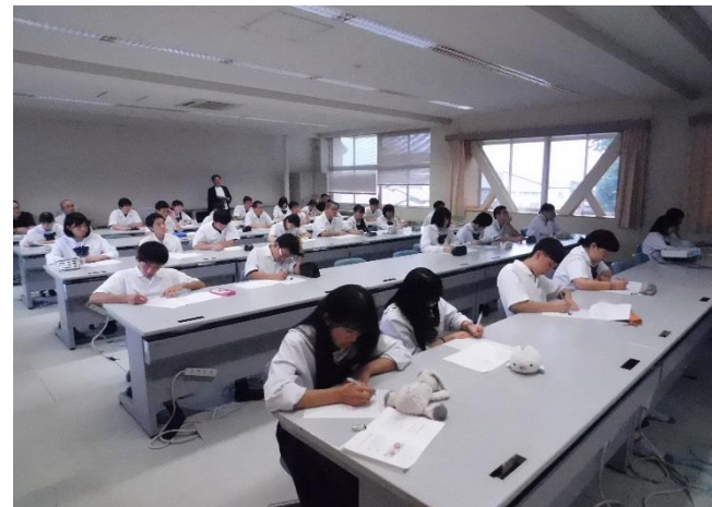
真剣にメモをとる2年生