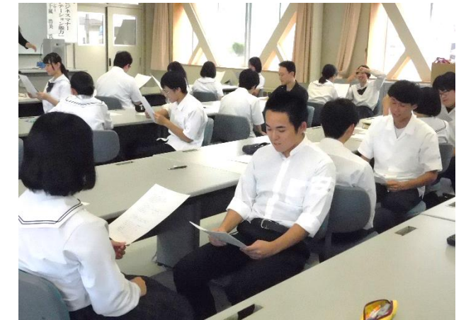
原稿を読み合い、互いに確認します