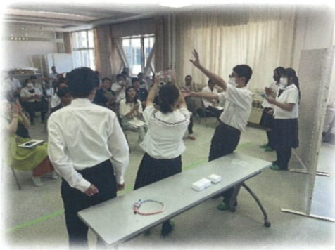
▲1年生「防災・減災学習発表会」の様子

各ページには下記のQRコードかURLから入ることができます。 生徒たちの活動の励みになります。ぜひ、フォローやいいねをよろしくお願いいたします。