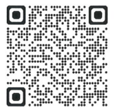
学校ホームページ

発行者 猪苗代高校活性化委員会 会長 二瓶 盛一（猪苗代町長） 編集 福島県立猪苗代高等学校 生徒会出版委員会 電話 0242-62-3125 学校ホームページ https://inawashiro-h.fcs.ed.jp 公式 note https://inawashiro-hs.note.jp 公式 X https://x.com/inako_tan9